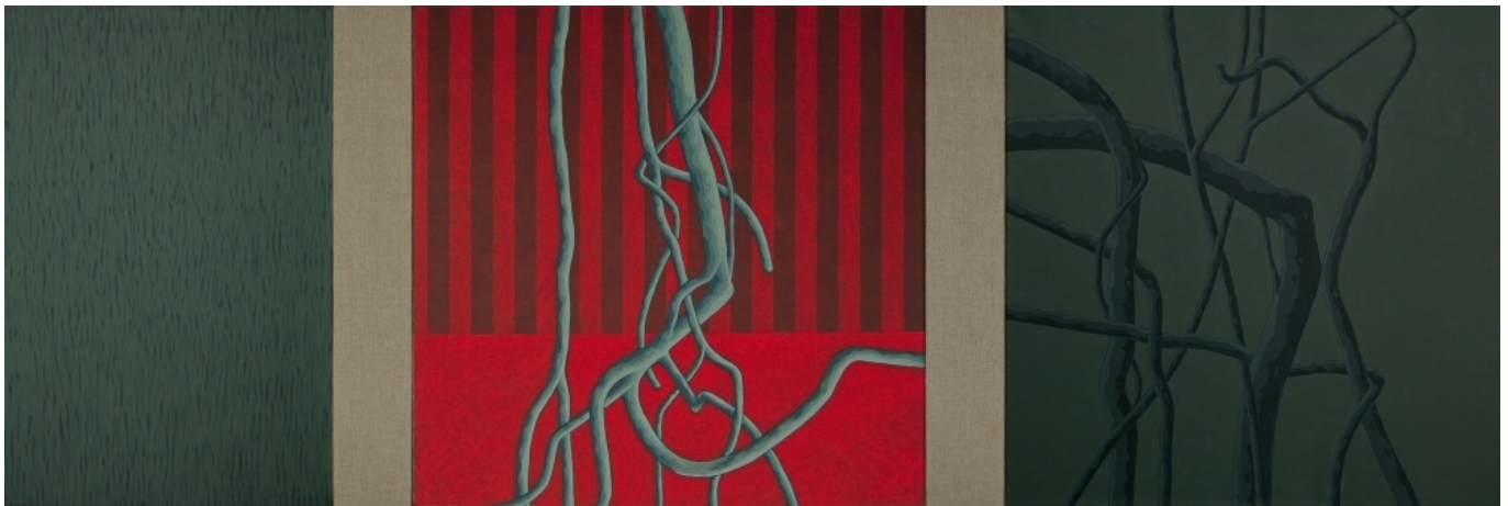
Acrylique sur toile - triptyque - 2010

visuels libres de droit avec la mention du photographe