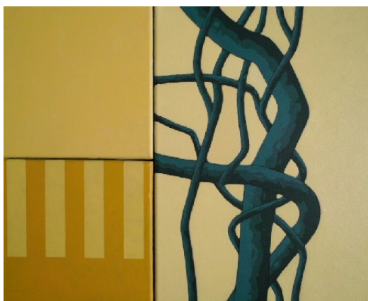
Acrylique sur toile 2010

Regarder dans le jardin, Fouiner, glaner des parcelles de nature. des morceaux choisis. J'en collecte des bouts. Revenir dans l'atelier, ingérer ces moments de réel, les laisser prendre leur place, s'assembler. Eux seuls font ce travail, je n'ai qu'à laisser faire. Attendre que ces fragments se rencontrent, s'amoncellent les uns aux autres. Je mélange, malaxe. Il n'y a que le temps qui compte, Lui seul restitue ce matériel d'images croisées, le fait ressurgir au regard du monde. Ensuite, il faut plonger dans ce nouveau jardin, le façonner, le détourner. Retranscrire ces instants sur des surfaces de toile. Assemblages aléatoires de traces végétales. ...Juste des assemblages.